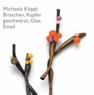
Michaela Köppl: Broschen, Kupfer geschwärzt, Glas, Email