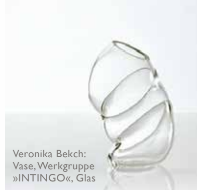
Veronika Bekch: Vase, Werkgruppe »INTINGO«, Glas