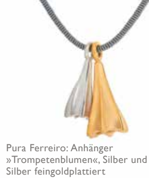
Pura Ferreiro: Anhänger »Trompetenblumen«, Silber und Silber feingoldplattiert